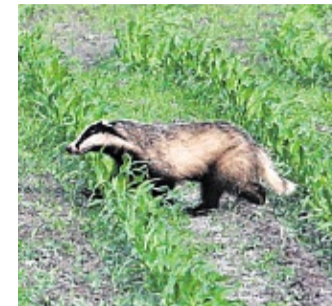
Dachse sind auch gefährlich.